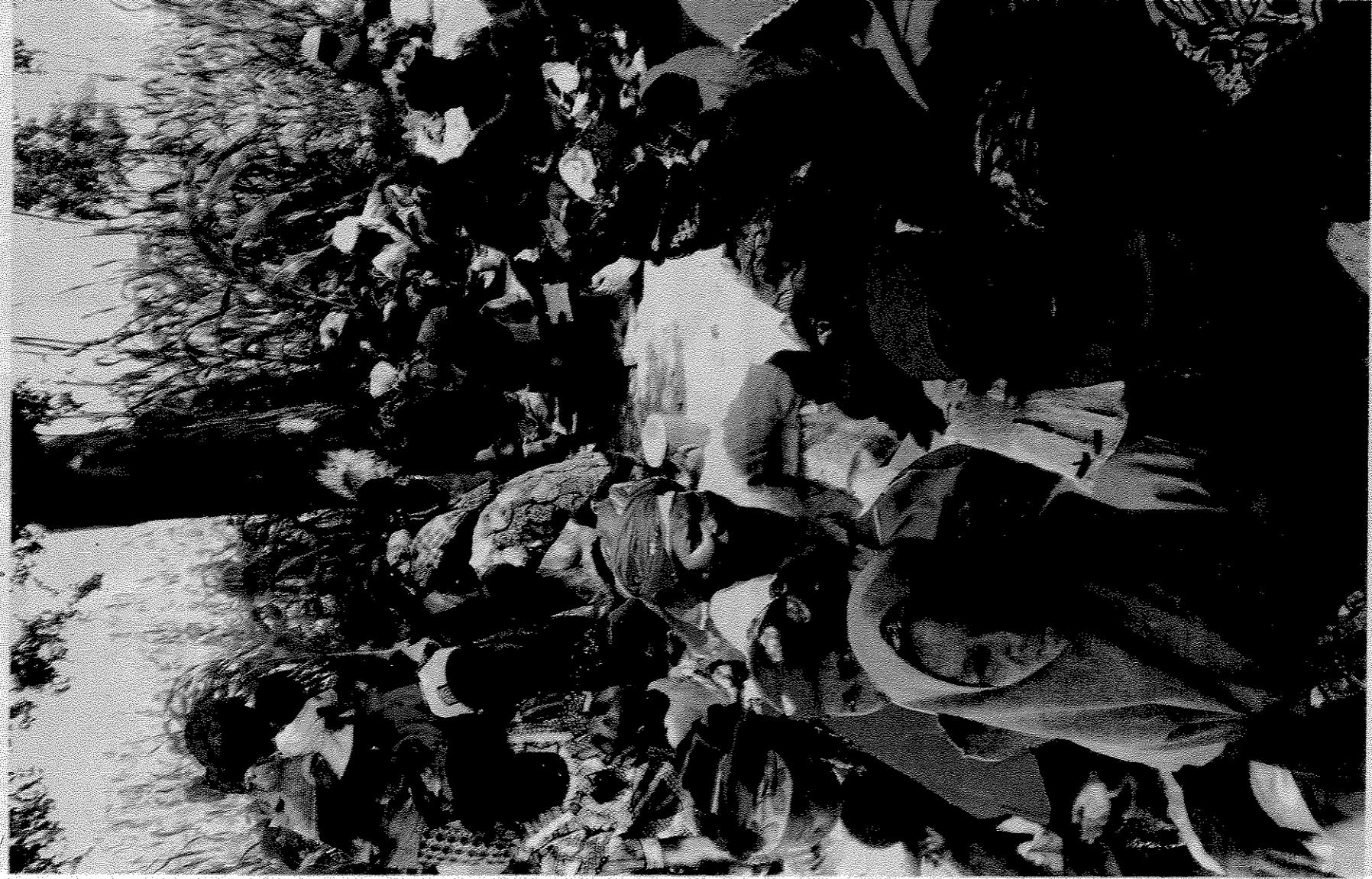
Ondanks alle uraniumopbrengsten voor de Nigerese staat blijft de bevolking zo arm als de straat.